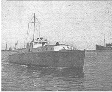
הספינה 'ארי הים' – Sea Lion