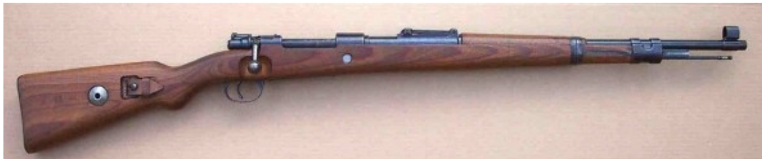
מאוזר K98 / P18 7.92mm, הוא "הרובה הצ'כי"

רובים נוספים שהגיעו מצ'כוסלובקיה – 10,000 ב-27 ביוני באוניית הנשק "הזקן", 2,100 ב-25 יולי באוניית הנשק "רקס" ו-8,000 רובים שהיו בדרכם לערבים, נתפסו ע"י כוחותינו במבצע "השודד" והובאו ב-28 באוגוסט לחיפה 5 – העלו את סך הרובים הצ'כים שבידי צה"ל ל-46,915 רובים. 6 עם קרב ל-50,000 רובים יכול היה צה"ל להמשיך ולספק רובה אישי לעשרות אלפי לוחמי החי"ר שהצטרפו יותר מאוחר למעגל המלחמה.