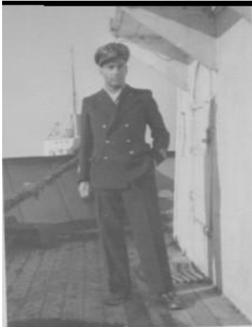
רב החובל, גבר לעניין ו"מבין עניין"

זאת בשל האמברגו, שהוטל על הבאת נשק לצדדים הלוחמים ומשקיפי או"מ הוצבו בנמלים לאכיפתו 5 (הגיעו הדברים לידי כך, שבהפלגתה השלישית בספטמבר 1948, שונה שמה ל- Icanosa). בניגוד לכמה אוניות רכש, בהן הצוות הזר הערים קשיים, שגרמו לאיחור בהפלגה, ראוי היה צוות ה- Maestrale למלוא השבחים, בעיקר בזכות הגרעין הסיציליאני, בראשות רב החובל. אמנם הצוות תוגמל כראוי, אך בתמורה, הוא גילה הזדהות ונאמנות בצד מיומנות מקצועית. בהקשר זה, מן הראוי להזכיר את הסכנות שהצוות ובעיקר רב החובל, נטלו על עצמם. בשל הפרת האמברגו הם הסתכנו באבדן הדיפלומה, שמשמעותו, במקרה "הטוב", פגיעה בפרנסה ובמקרה הגרוע, במאסר; אך חמורה מכך הייתה סכנת חיים. מעגן ת"א ספג כמה הפצצות אוויריות בחודשי מאי – יוני 1948 (ואחד ממלחי אונית הרכש 'אטלס'- Apuania נפצע מרסיס).