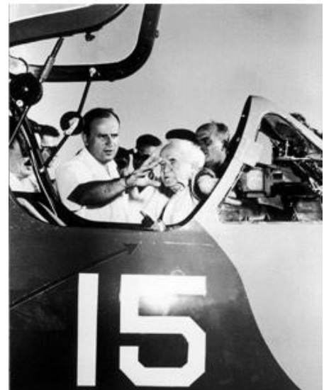
מציג בפני בן גוריון את מטוס הפיגוע. לא השתגע על מפא"י