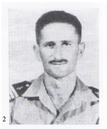
יוס'לה דרור מקים ומפקד שייטת הצוללות