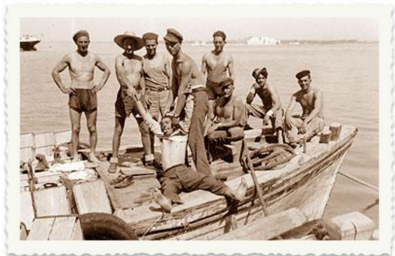
שלטון המנדט מתיר לנציגי הישוב העברי להקים את נמל תל-אביב.