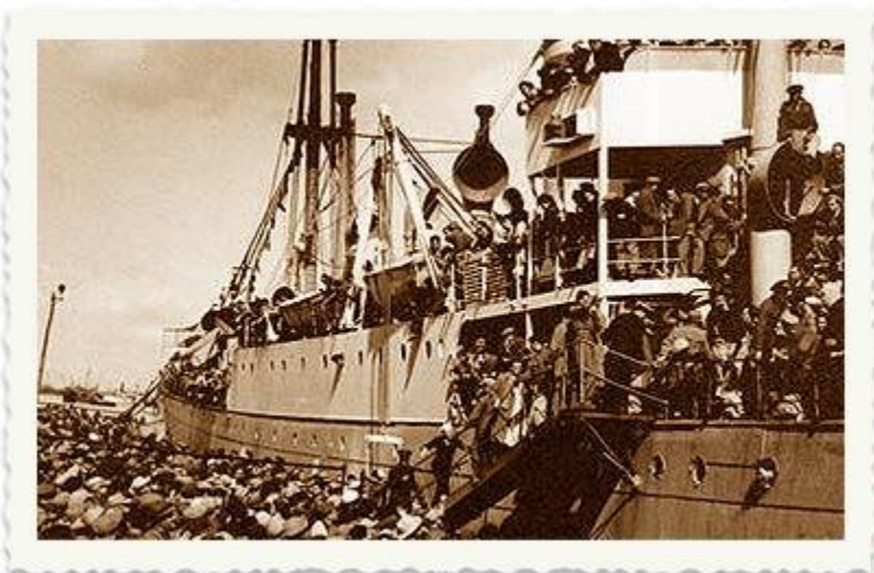
המעפילים מטפסים בהמוניהם על ה"עצמאות" בדרך לארץ ישראל

לאחר ה-29 בנובמבר '47 הייתה ההעפלה נושא למחלוקת בין מוסדות היישוב בארץ לאנשי המוסד לעלייה ב'. משה שרתוק (לימים שרת) סבר שהבאת אלפי מעפילים בעת ההיא תגרום לארה"ב לחזור בה מתמיכה בתוכנית החלוקה. לעומתו, טען שאול אביגור (מאירוב), ראש ארגון עליה ב', שיש לקיים את העלייה בכל תנאי. בינתיים המעפילים עלו על האוניות ולא ניתן היה להמתין. בן גוריון ומשה שרתוק נאלצו למצוא פשרה - ה"פאנים" יוסגרו לבריטים ויובלו למחנות קפריסין.