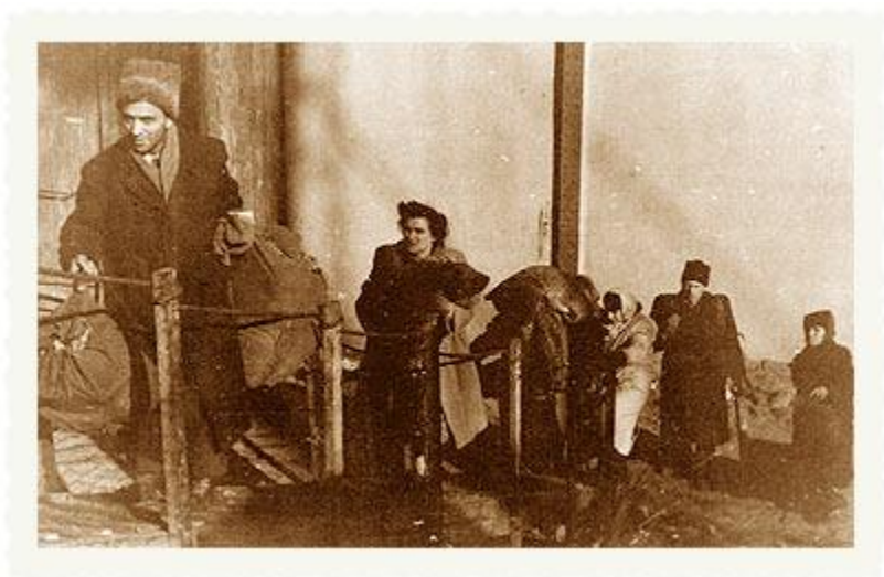
מעפילים עולים ל"עצמאות". מי מזהה?

לאחר ה-29 בנובמבר '47 הייתה ההעפלה נושא למחלוקת בין מוסדות היישוב בארץ לאנשי המוסד לעלייה ב'. משה שרתוק (לימים שרת) סבר שהבאת אלפי מעפילים בעת ההיא תגרום לארה"ב לחזור בה מתמיכה בתוכנית החלוקה. לעומתו, טען שאול אביגור (מאירוב), ראש ארגון עליה ב', שיש לקיים את העלייה בכל תנאי. בינתיים המעפילים עלו על האוניות ולא ניתן היה להמתין. בן גוריון ומשה שרתוק נאלצו למצוא פשרה - ה"פאנים" יוסגרו לבריטים ויובלו למחנות קפריסין.