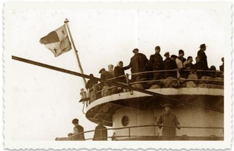
אניית המעפילים "עצמאות". ב-1 בינואר 1948 הגיעה לחופי קפריסין