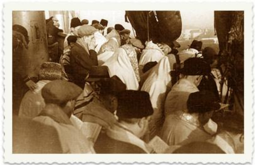
על סיפון העצמאות. תפילת המעפילים