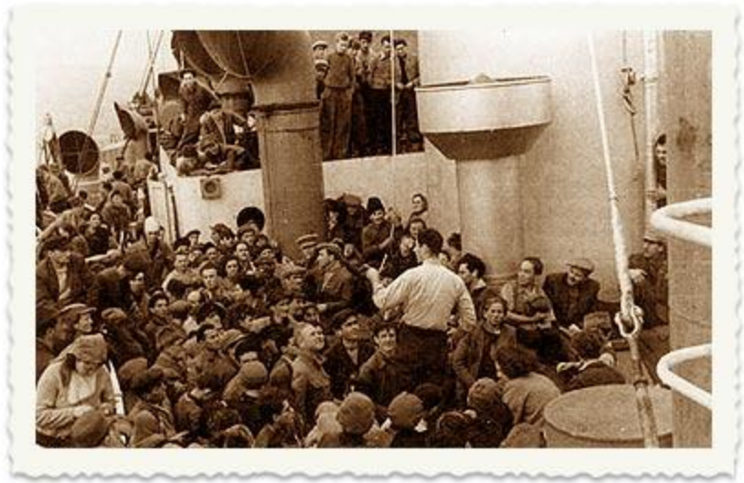
נדחקים על הסיפון