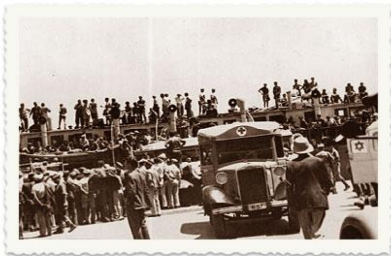
רציף הגירוש בנמל חיפה.

האוניה חיים ארלוזורוב יושבת על שרטון מול חוף בת-גלים. אנשי צוות האנייה התקינו פתחי טביעה בתחתיתה, כדי להציפה ולמנוע גרירתה בידי הבריטים