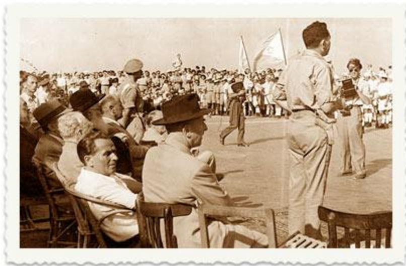
בטקס מסירת הנמל (בלבן אבא חושי, לימים ראש העיר חיפה)

בינתיים בארץ, ישראל מקבלת ריבונות על נמל חיפה