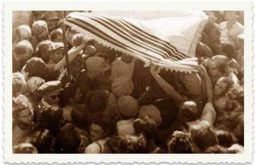
חתונה במחנה המעצר בקפריסין