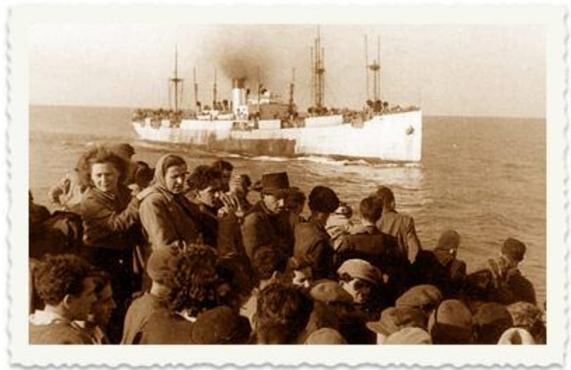
ה"פאנים" יצאו עם המעפילים ב-24 בדצמבר 1947 מנמל בורגס. לאן הגיעו תחילה?