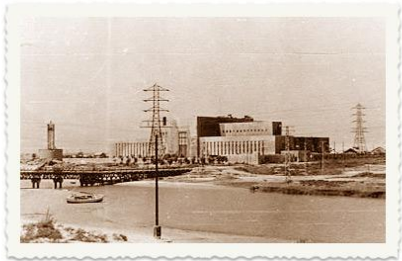
בשנת 1936 פורץ המרד הערבי בארץ ישראל. הערבים משביתים את נמל יפו.