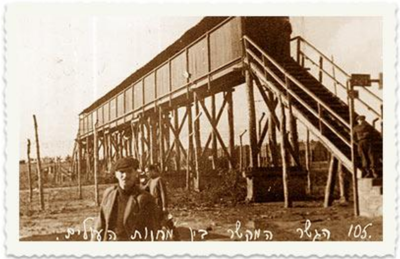
הגשר שחיבר בין מחנות המעצר בקפריסין. מי מזהה?