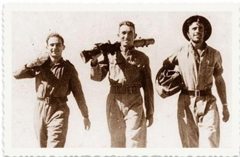
בשנת 1941 התקיים שיתוף פעולה בין ההגנה לצבא הבריטי כנגד אפשרות של פלישת גרמניה למזרח התיכון. הוקם הפלמ"ח ובתוכו פלוגות הים. ברצ'יק (מימין) הופך למדריך ומכשיר את חברת כ"ג יורדי הסירה.