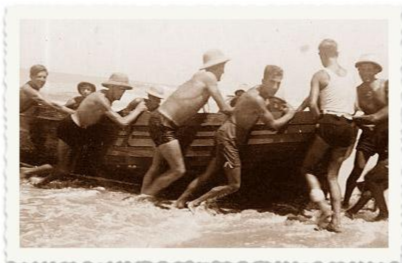
בהמשך עוברים חברי החוג הימי לקיבוץ שדות ים, שם לצד העיסוק בדיוג הם מתאמנים בחוף קיסריה.