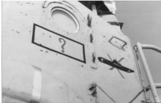
היה מי שהזדרז וציין את האירוע על דופן האוניה

באתר נתגלו על פני המים כתמים כהים בצבע הפיח ורצועה קרועה של אטם גומי. ממצאים אלו דווחו למפקדה. בתשובה לשאלת מפקד החיל "האם אפשר לברך על המוגמר"? נאלצתי להשיב שאין לי מה להוסיף על הממצאים שדווחו. לצערי לא יכולתי לדווח לו יותר מאשר ראיתי (דווח מלא שמע "הבוס" יחד איתי לאחר כעשרים שנה, אבל אני מקדים את המאוחר). מיד לאחר המלחמה הגיעו ידיעות מודיעין בדבר צוללת מצרית העוברת תיקונים, שאופיים מצביע על היתכנות שנגרמו מהתפוצצות קרובה של פצ"ם (בעגה המקצועית Near Miss), וב"עלון הקרב" החילי הופיעו כתבות על תקיפת צוללות על ידי ה"חיפה".