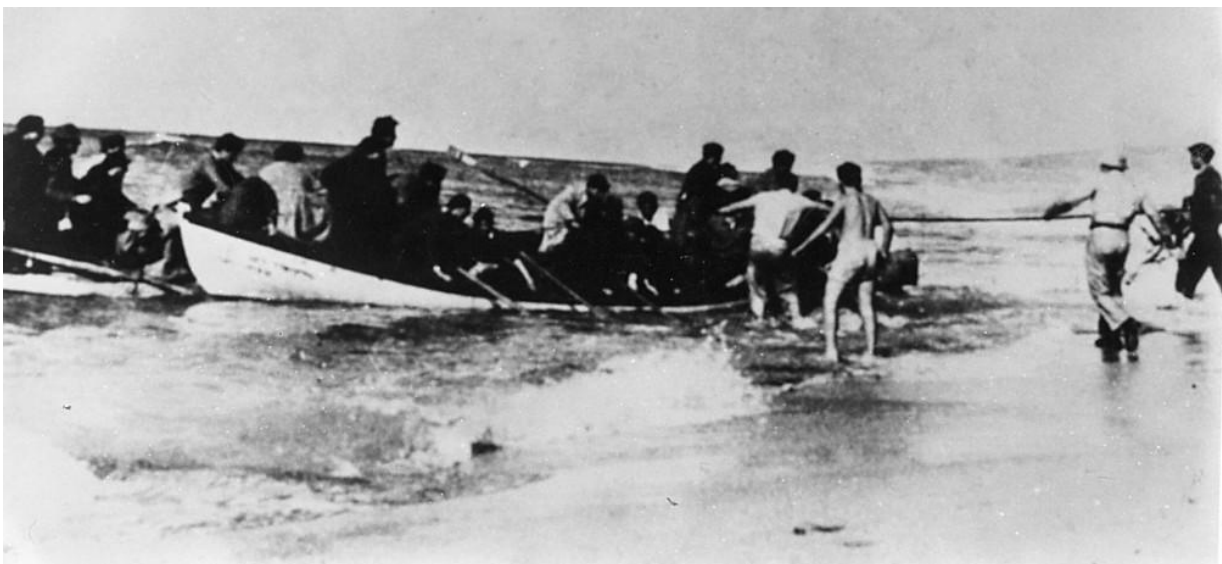
הורדת מעפילי 'האומות המאוחדות' בחוף נהריה, 1 בינואר 1948