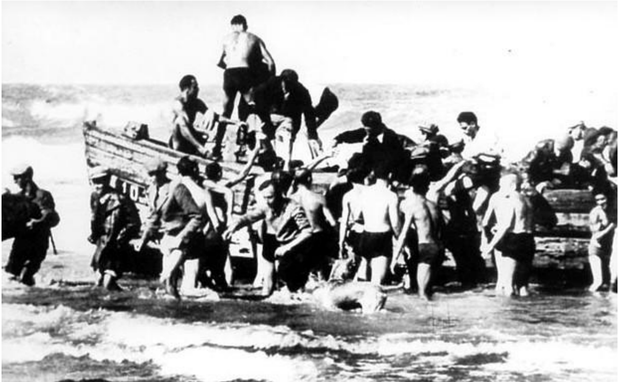
הורדת מעפילי הספינה 'עמירם שוחט' בחוף שדות ים, אוג' 1946