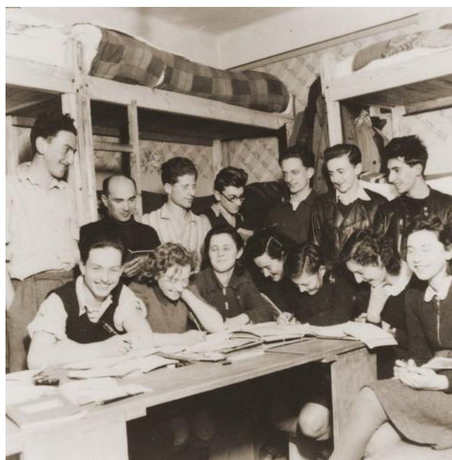
חבורת נוער בשאבץ

כל אותו קיץ 1940 נישארו הפליטים בקלאדובו "תקועים" באותו המקום, אם כי לא סבלו עוד כפי שסבלו בחורף. האנשים עסקו בספורט, שיחקו, קיימו ערבי הווי ועוד. זוגות חדשים ואהבות פרחו, ו-15 חתונות נערכו. תרצה מתארת: "הדנובה זרמה והכל היה ירוק", שם הכירה והתאהבה בבעלה לעתיד, אלוף דן לנר. בחודש ספטמבר קיבל שפיצר רשות מהשלטונות להעביר את כל הקבוצה לשאבץ, עיירה קטנה בקרבת בלגרד הבירה. חלק מהאנשים גרו בבתי פרטיים, קבוצת אנשי "החלוץ" התמקמה בטחנת קמח שרופה, הבנים בקומה אחת והבנות בקומה מעל, המטבח היה משותף. בשאבץ הייתה קהילה יהודית קטנה, כ-70 איש, ובניין בית הכנסת הפך לבית ספר לילדים הקטנים, כ-20 במספר.