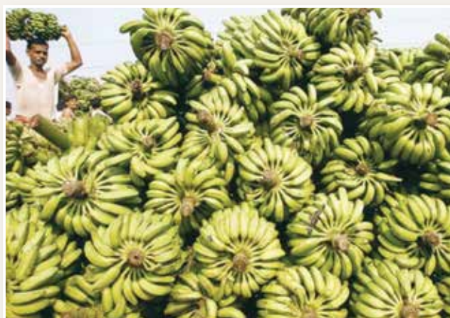
קטיף בנגות מוכן למשלוח