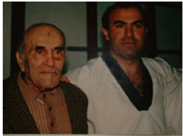
אימי בערוב ימיו

ב- 1964 פשט את המדים והחל ללמד תורתו לאזרחים ולגופים ציבוריים שונים.