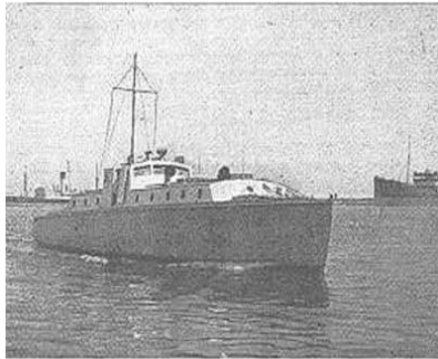
הספינה 'ארי הים' – Sea Lion

הערה: כתבה זו הורחבה ב-2013 בעקבות פרסום דו"ח תמציתי המבוסס על הדו"ח המלא (השמור בארכיון צה"ל), פרי מחקר שנערך ע"י ד"ר משה עמי-עוז ונרי אראלי בשנים 2000-2007. לדברי החוקרים, "ממצאי החקירה הנוכחית העלו בוודאות כי בניגוד למה שסברו קודם – הספינה לא הגיעה כלל ליעדה" – חבלה במתקני בית-הזיקוק בטריפולי, לבנון. תעלומת העלמות הסירה על 24 הלוחמים שירדו בה לא נפתרה עדיין.