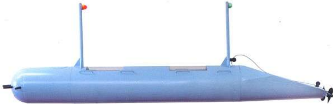
דגם הכריש שהוכן ברפאל 5

בעוד הצוות מצפה לפקודת ביצוע, הופיע רץ רכוב על אופנוע ובידו הוראה מאת בן-גוריון לבטל את הפעולה, מחשש שתגרום לעימות חמור עם ממשלת בריטניה. 4