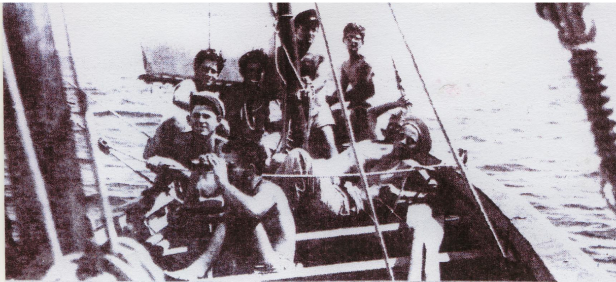
קורס מפקדי סירות מס' 6 - 1946

היחידות של הפלוגה היו בשדות-ים, בקיבוץ מעברות, בעין-המפרץ ובמספר משקים נוספים הגובלים עם הים. עיקר הפעילות של הפלוגה הימית היה להכשיר מלווי ספינות מעפילים, ללוות אותן בדרכם ארצה, לעסוק בהורדת המעפילים מהספינות בהגיען ארצה כולל אבטחת אזור הפעולה ופיזור המעפילים בישובים השונים ועוד.