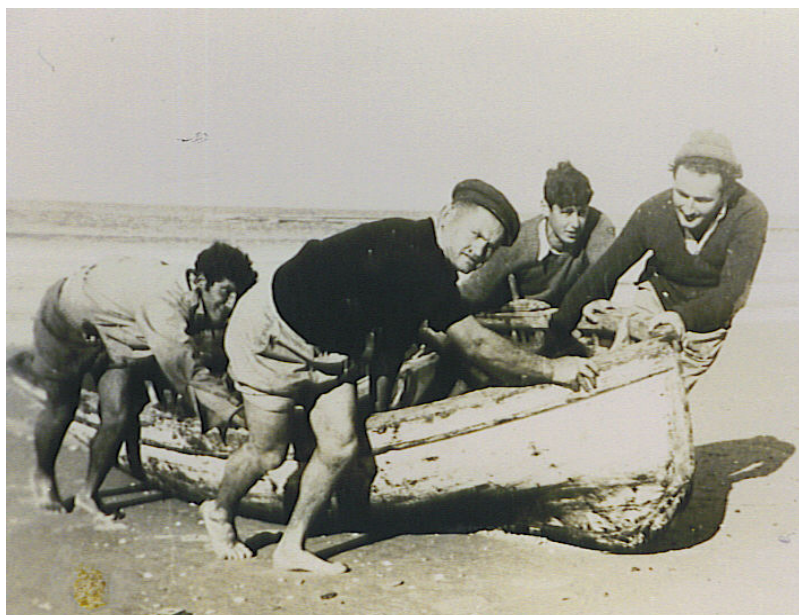
בקורס מפקדי סירות מספר 5

הטביעה הקשה ביותר היתה מפגיעת טורפדו גרמני באוקינוס האטלנטי , ליד חופי מרכז אמריקה . כשאוניה טובעת כל מי שנמצא בקרבתה נסחף פנימה , רק שחיין טוב יכול להתגבר על הכוח המושך . למזלי התחילו לצוף על המים לוחות עץ ומכסים של המחסנים , נאחזתי בהם . פעמיים מסרתי את הלוחות לימאים שיעזרו בהם ומצאתי לעצמי לוחות אחרים . בשלישית מצאתי סולם , ישבתי עליו וחתרתי בעזרת לוח עץ . הבחנתי ברפסודה שנשמטה מהאוניה , וחתרתי להשיגה . היא התקדמה עם הרוח והזרמים . הגעתי ומצאתי עליה שני ימאים . אילצתי אותם לחתור חזרה נגד הרוח כדי לאסוף את הימאים שהשארתי אחרי . אספנו אותם ועוד ימאי נוסף . כך שהיינו ברפסודה שישה אנשים . בבוקר נסחפנו עם הזרם לקבוצת איים . כשהתקרבו , הקיפו אותנו כרישים , שלא עזבו אותנו במשך ארבעה ימים וארבעה לילות . לולא אספנו את שלושת האנשים האלה , אין ספק שהם היו טרף לכרישים . ביום החמישי נאספנו על ידי ספינת משמר חופים אמריקאית לטרינידד . שם מצאנו עוד שלושה ניצולים מן האוניה . זה מה שנשאר מתוך צוות של 47 איש . המשכתי באוניה בריטית בשירות המלחמה . השתתפתי גם בפלישה לדרום צרפת באניה שהובילה הספקה ושני בתי חולים שדה , על צידום וציוותם . בשנת 1945 , כשהגעתי ארצה , פגש אותי יענקל'ה סלמון וקרא לי לחזור לפלמ"ח . ואכן חזרתי באוקטובר לפל"ם , לקורס מפקדי סירות החמישי , כשמאחורי כבר נסיון ימי . אחרי הקורס נשלחתי לקורס חובלים שהתקיים ביגור .