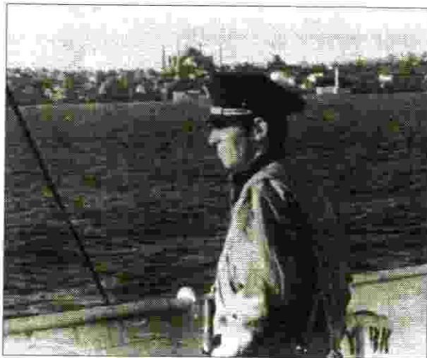
ר/ח האוניה "פאן יודק" עם 7,600 מעפילים במעבר ה"בוספרוס"