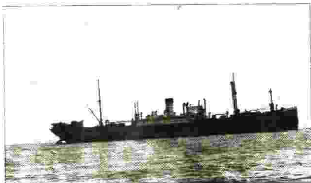
"פאן יורק" - היא קיבוץ גלויות"

מכתב התחייבות של מושל פמגוסטה לצוותי האוניות "פאן יורק" ו-"פאן קרשנט"