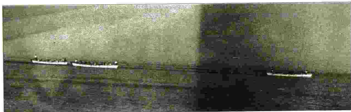
אימוני חתירה בקורסים למפקדי הסירות

עם שובי לארץ ב-1948 הישוב בארץ היה נתון במלחמת העצמאות, והתגייסתי עם חברי חיים גורי ליחידת הצנחנים, שהחלו בהקמתה. ביחידה זו שירתתי עד שחרורי מצה"ל. עם שחרורי מצה"ל, ואני אז בן עשרים וחמש, פניתי ללימודים. מאחר ולא למדתי בבי"ס תיכון, למדתי בעצמי במשך שנה, עמדותי בבחינות אקסטרניות והתקבלתי לאוניברסיטה העברית ללימודי פולוסופיה והיסטוריה. לאחר קבלת תואר B.A. זכיתי במלגת לימודים באוניברסיטת New School for Social Research בניו-