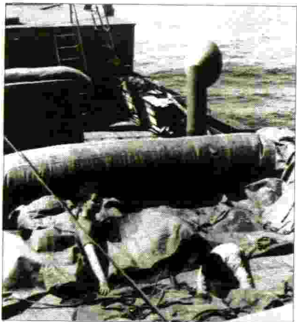
לאחר העברת המעפילים לאוניה "יחיעם"