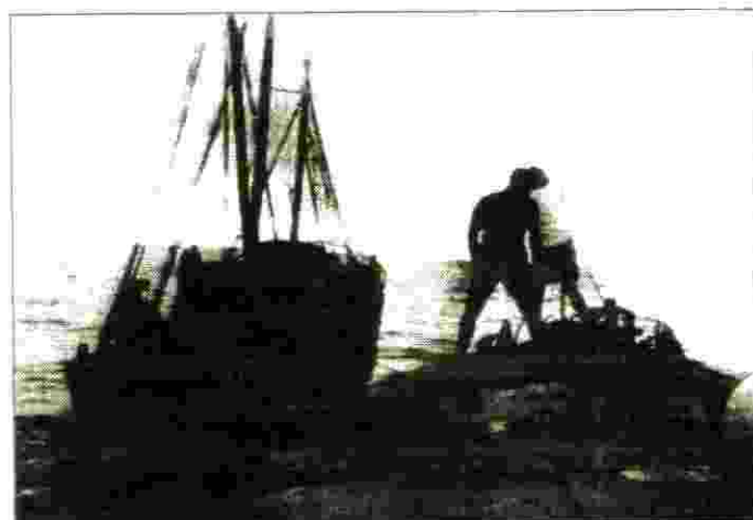
"Maria Anick" הגיעה לארץ כספינת מעפילים "הפורצים"

עם הכרזת ההפוגה הראשונה במלחמת העצמאות ירדתי