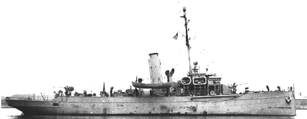
ה'אולואה' במקורה כספינת משמר חופים בשם USS WPG-53 Unalga