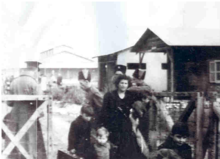
<<<<<< עולי "ניאסה" בעתלית