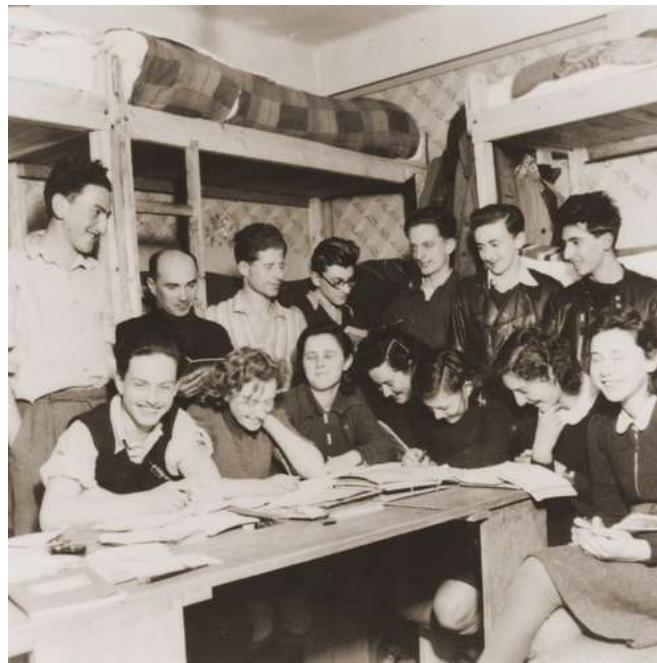
חבורת נוער בשאבץ

כל אותו קיץ 1940 נישארו הפליטים בקלאדובו "תקועים" באותו המקום, אם כי לא סבלו עוד כפי שסבלו בחורף. האנשים עסקו בספורט, שיחקו, קיימו ערבי הווי ועוד. זוגות חדשים ואהבות פרחו, ו-15 חתונות נערכו. תרצה מתארת: "הדנובה זרמה והכל היה ירוק", שם הכירה והתאהבה בבעלה לעתיד, אלוף דן לנר. בחודש ספטמבר קיבל שפיצר רשות מהשלטונות להעביר את כל הקבוצה לשאבץ, עיירה קטנה בקרבת בלגרד הבירה. חלק מהאנשים גרו בבתי פרטיים, קבוצת אנשי "החלוץ" התמקמה בטחנת קמח שרופה, הבנים בקומה אחת והבנות בקומה מעל, המטבח היה משותף. בשאבץ הייתה קהילה יהודית קטנה, כ-70 איש, ובניין בית הכנסת הפך לבית ספר לילדים הקטנים, כ-20 במספר.